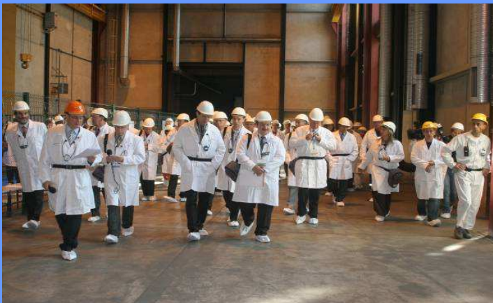
Pierrelatte (usine d'enrichissement)

Les participants ont eu accès à l'ancienne usine d'enrichissement de l'uranium de Pierrelatte et ont visité, sur le site de Marcoule, l'un des trois réacteurs plutonigènes ainsi que l'usine de retraitement militaire. Ils ont ainsi pu constater le caractère concret et effectif de la décision prise par la France en 1996 de cesser toute production de matières fissiles pour ses armes nucléaires et de démanteler ses installations de Pierrelatte et Marcoule dédiées à cette production.